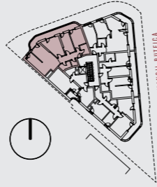
APARTAMENT TIP 4C2 - ETAJE 1-4