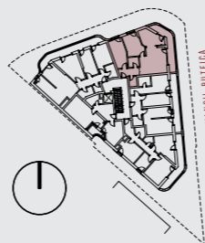
APARTAMENT TIP 3C3 - ETAJE 1-4